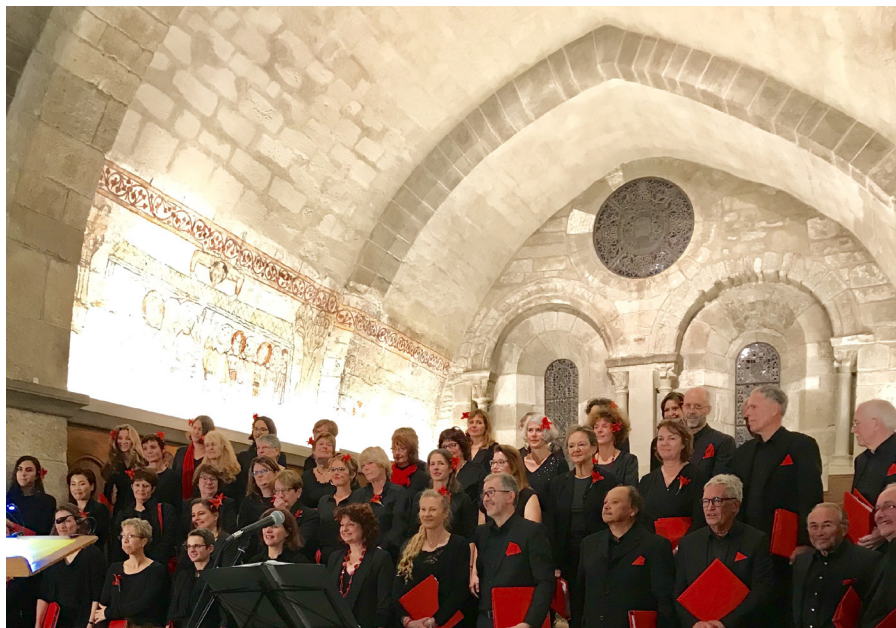
Ensemble Choral de la Côte, 6-7 mai 2017.