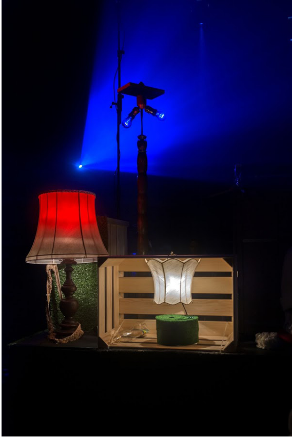
Collectif Hapax 21, «Osnoise» le 16 septembre 2017.