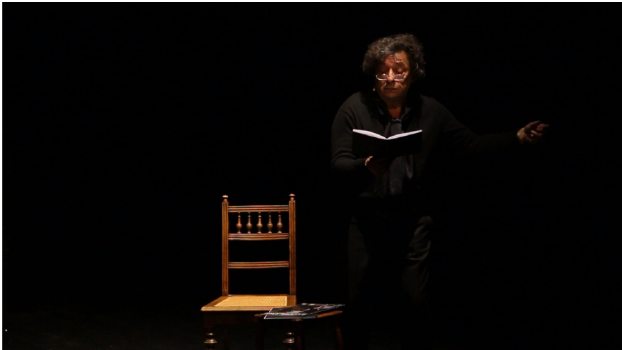
Théâtre Païta, «Baudelaire, Fleurs du Mal» et «Spleen de Paris», Théâtre de Narens, Nyon, 25 novembre 2017.